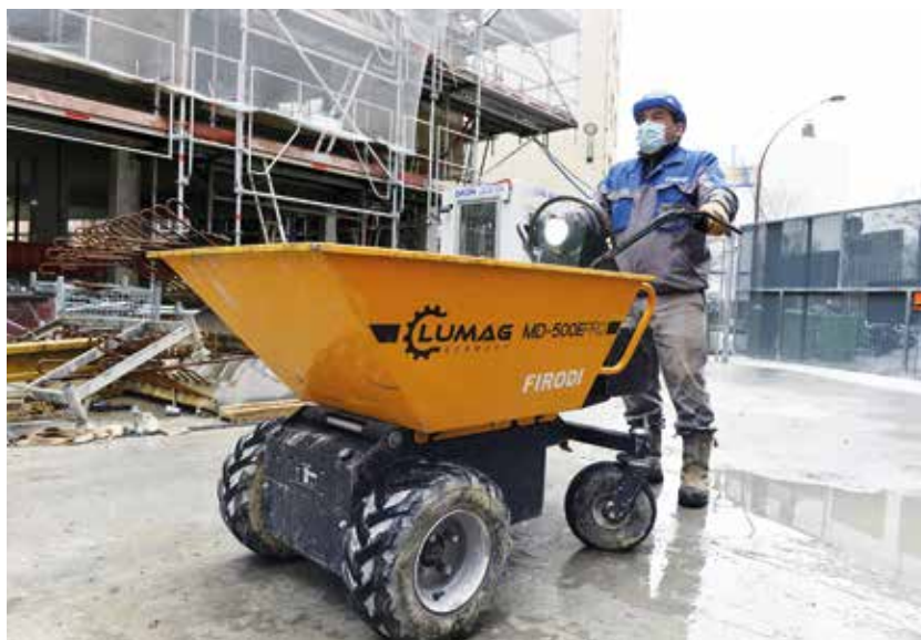
La brouette électrique est utilisée aussi bien pour les approvisionnements en sable que pour les retraits en déchets ou gravats.

En travaux de construction, les opérateurs peuvent compter sur une brouette électrique pour les approvisionnements de sable ou les retraits. Intervenant en milieu urbain dense, dans des espaces exigus, l'entreprise privilégie les solutions facilitant déplacements et manutentions. Le renouvellement des pompes à